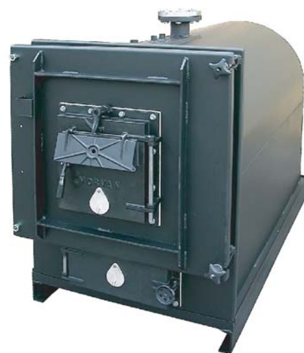
Corps de chauffe nu

De nombreuses références d'installations témoignent de la qualité du produit et de l'expérience de MORVAN dans ce domaine.