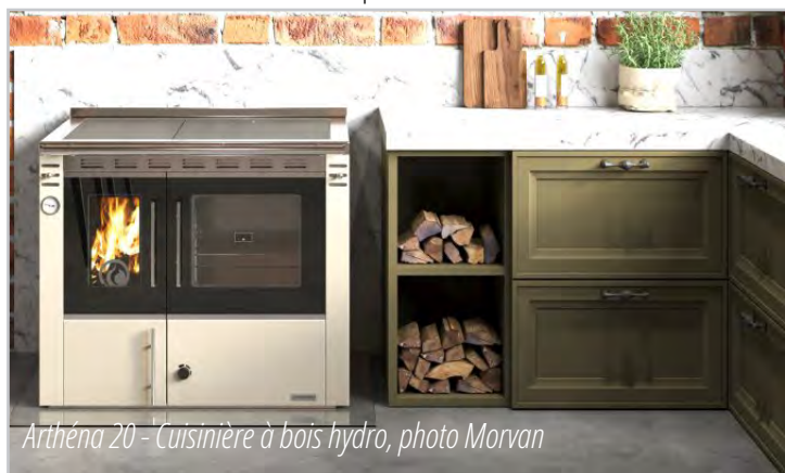
Arthéna 20 - Cuisinière à bois hydro

Avec ses modèles Cook'R, Arthéna et Élégance, Morvan perpétue le savoir-faire de la cuisinière à bois en le réinterprétant pour les usages d'aujourd'hui. Véritables équipements multifonctions, elles permettent à la fois de chauffer l'habitat et de cuisiner tout en profitant du confort et du plaisir d'un feu au bois. La gamme de cuisinières se décline sous une puissance de 5 à 18 kW.