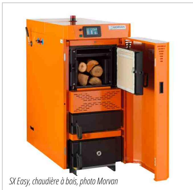
SX Easy, chaudière à bois

Cette offre s'enrichira encore d'un nouveau modèle, la Cook'R 40 à l'automne 2026 : une cuisinière compacte avec foyer vitré, 40 cm de largeur, puissance de 4,5 kW et encastrable en cuisine en option.