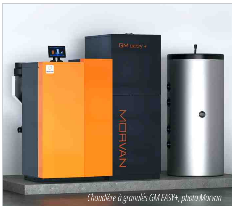
Chaudière à granulés GM EASY+