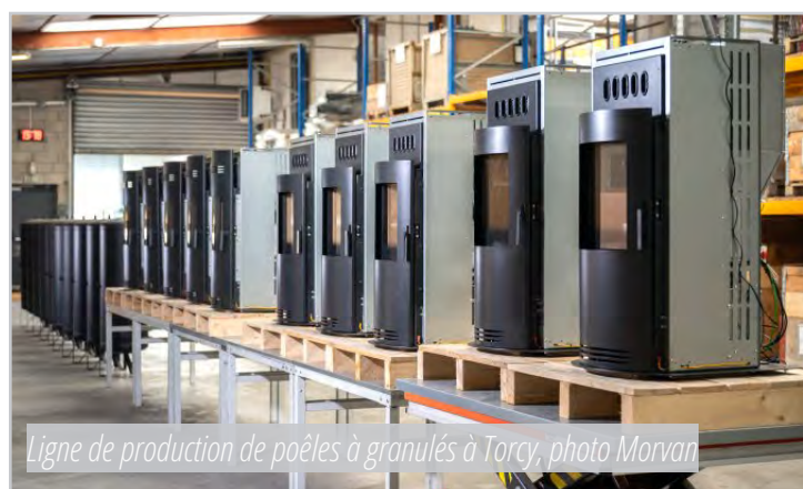
Ligne de production de poêles à granulés à Torcy

Cette expertise se traduit par une offre complète capable de répondre à tous les besoins résidentiels : chauffage principal, chauffage d'appoint, rénovation énergétique, maisons individuelles, habitats contemporains ou traditionnels.